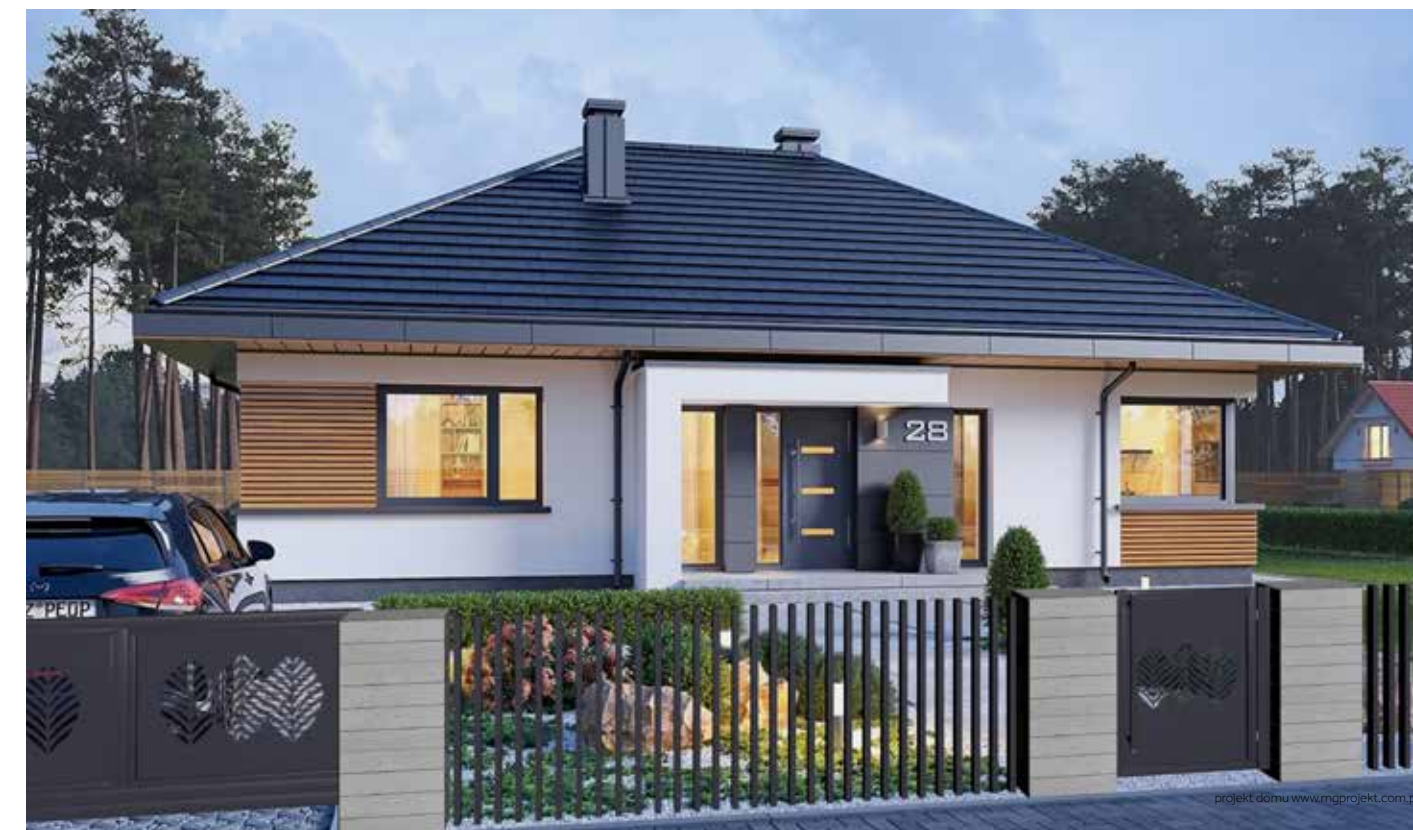
PRZYKŁAD ZASTOSOWANIA PRZĘSŁA SODALIT Z FURTką I BRAMĄ PS Z BRYTAMI WYCINANYMI LASEROWO