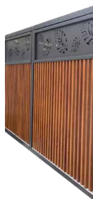
Profile SODALIT w sublimacji użyte jako ścianka wiaty